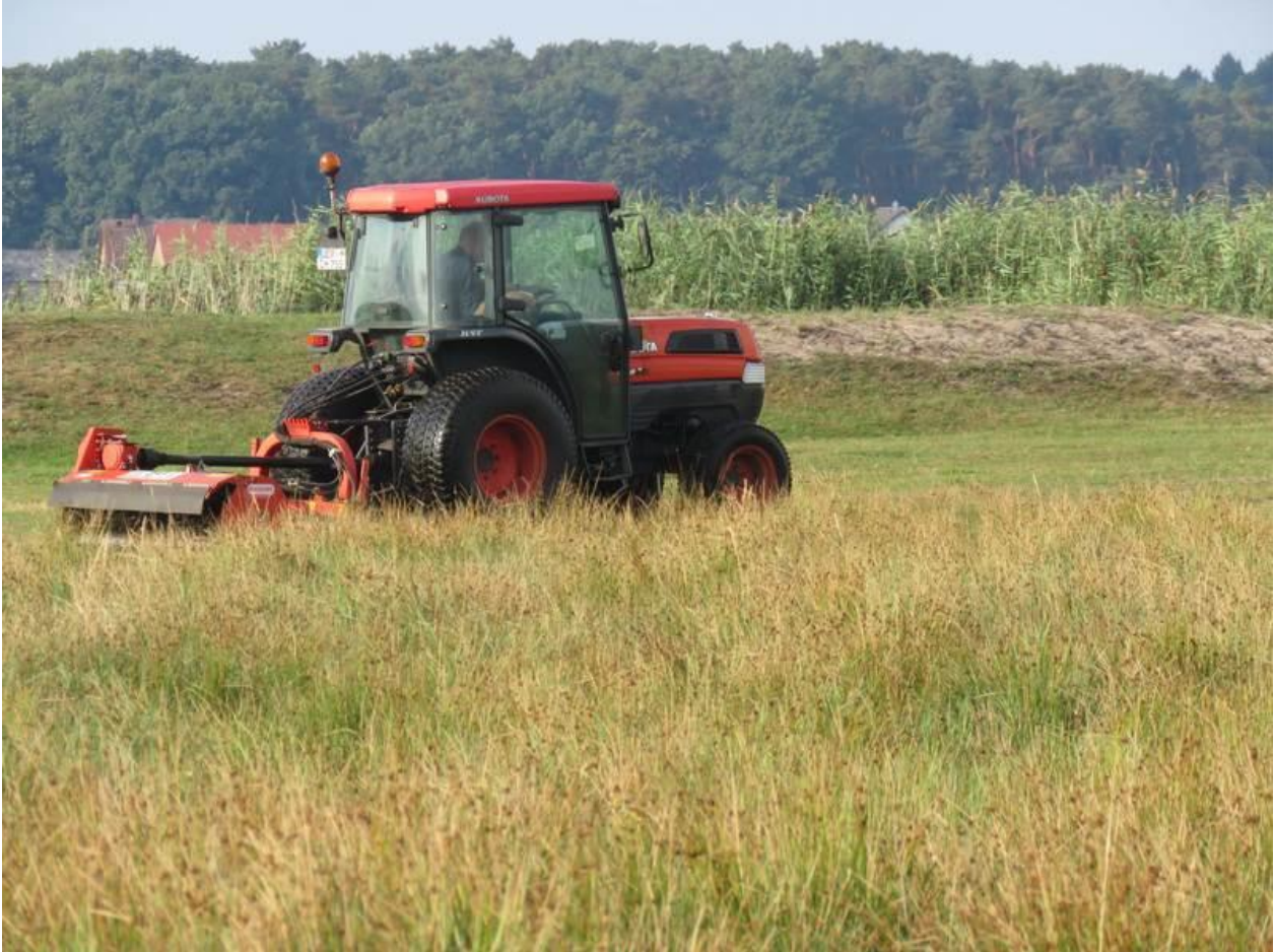
Grünlandpflege mit dem fördervereinseigenen Kleintraktor