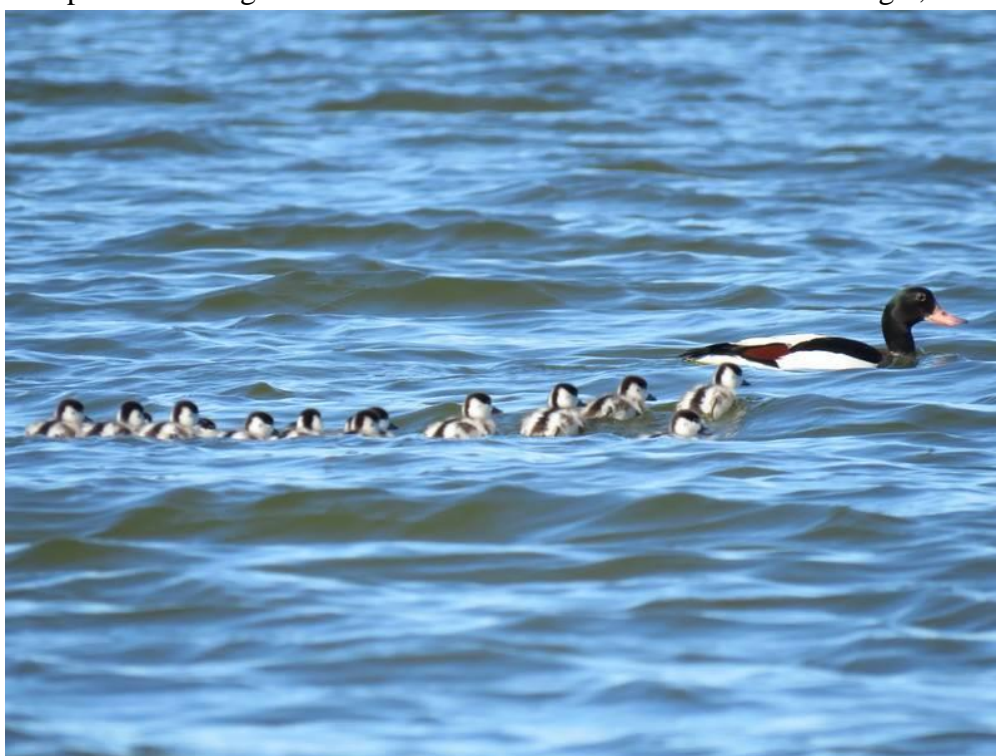
Brandgans mit Gössel