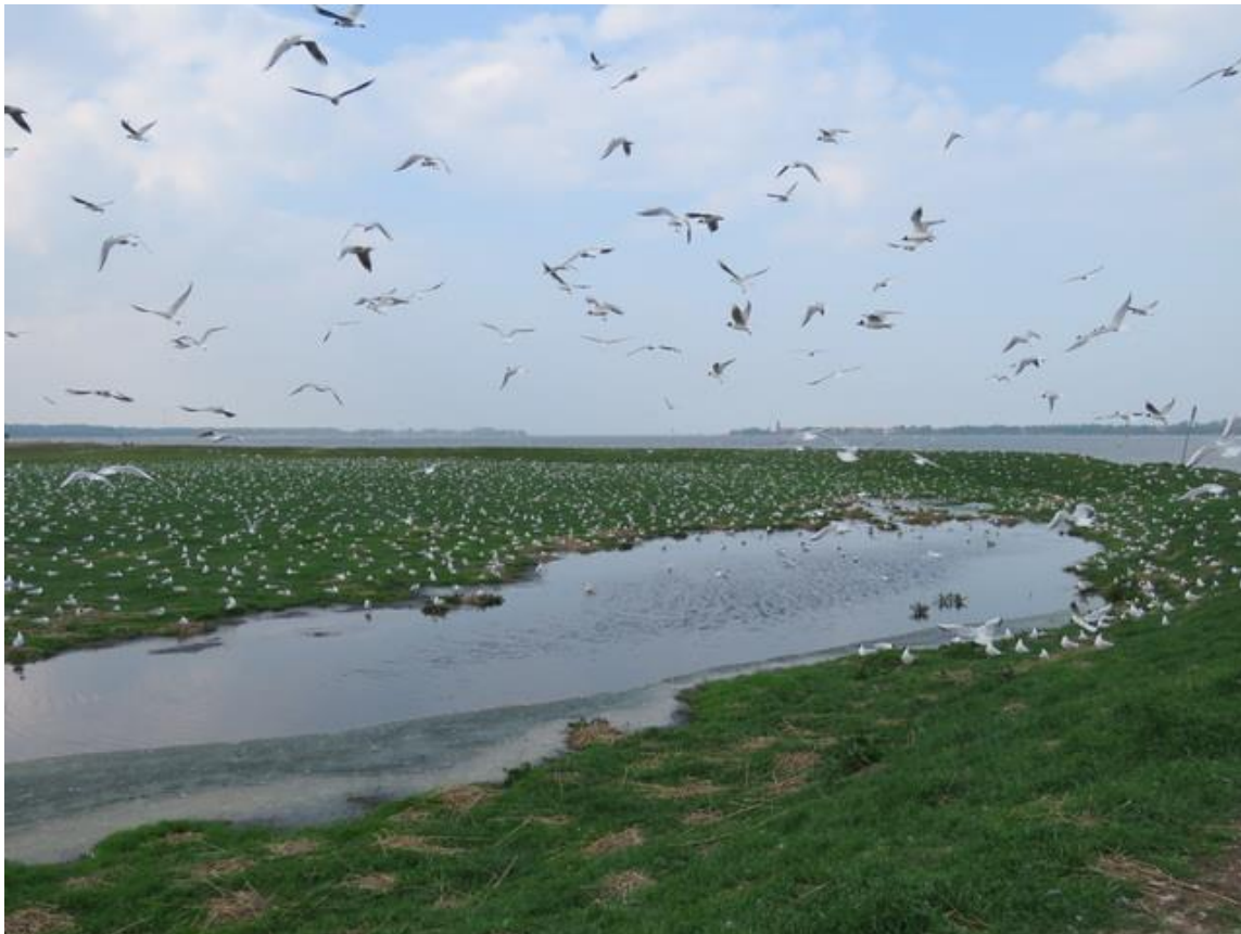
Lachmöwenkolonie auf der Ostseite der Insel