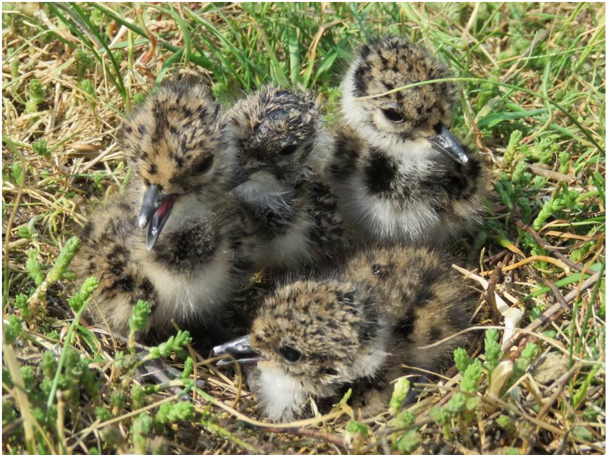
Frisch geschlüpfte Kibitzkükens