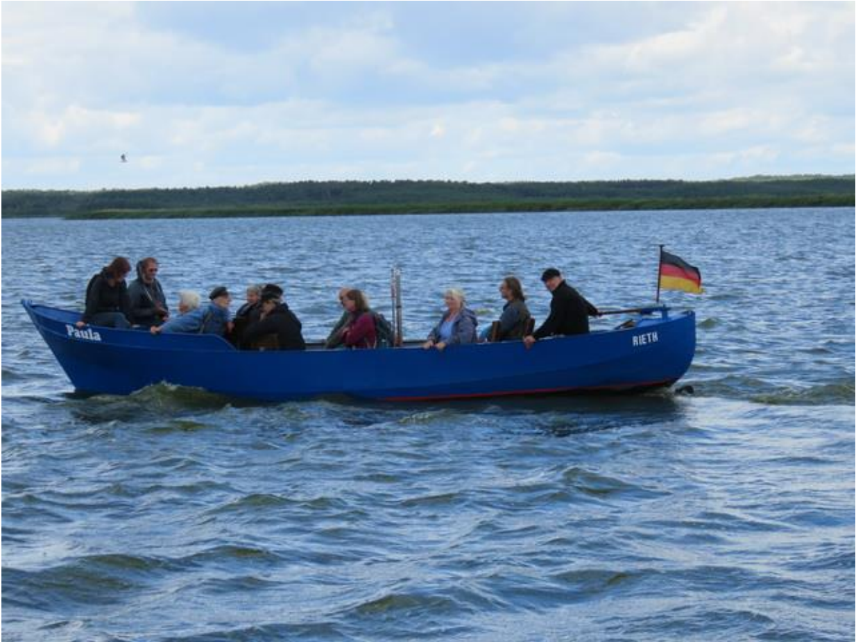
Teilnehmer an einer erlaubten Inselführung