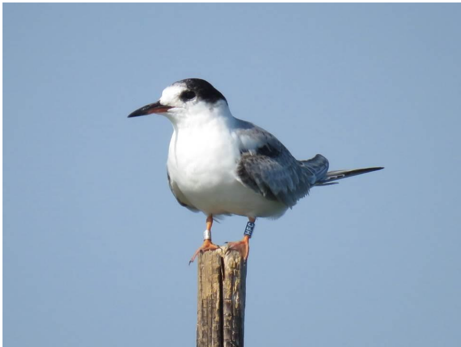
Diesjährige Flußseeschwalbe 23.08.2018

Beringt am 10.07.2018 auf einem künstlichen Brutfluss Nonnenhof, Tollensesee