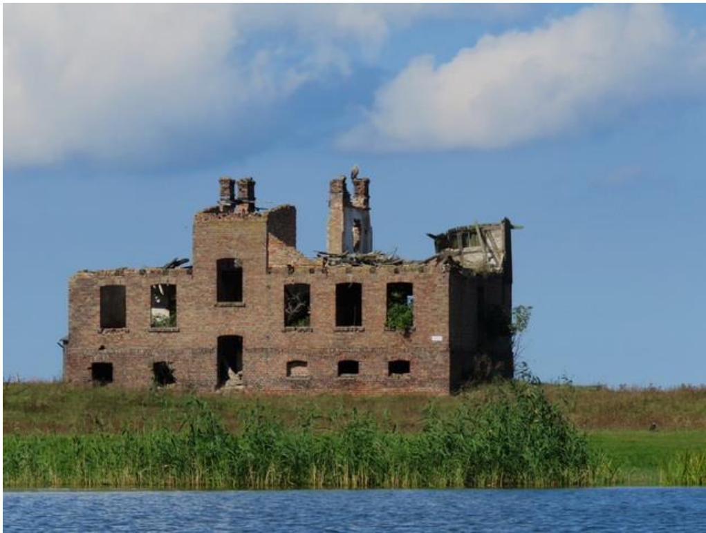
Rastende Seeadler auf der Gebäuderuine