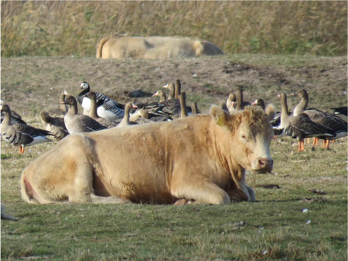
Rind mit verschiedenen Gänsearten