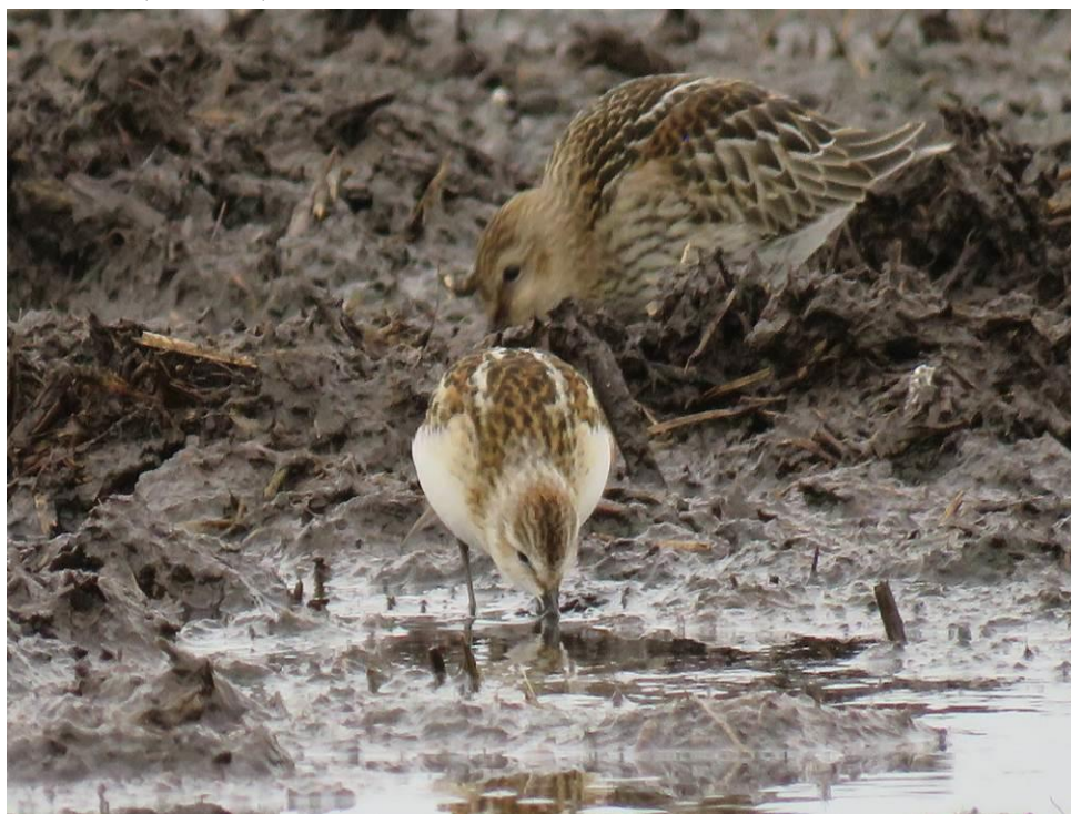
Zwergstrandläufer vorn Alpenstrandläufer hinten