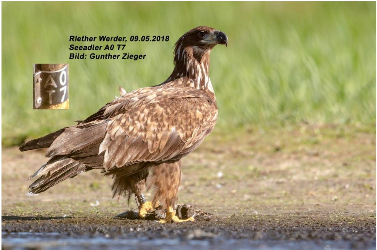
Beringt 22.05.2017 Schönfeld, Meißen, Sachsen 272 km S