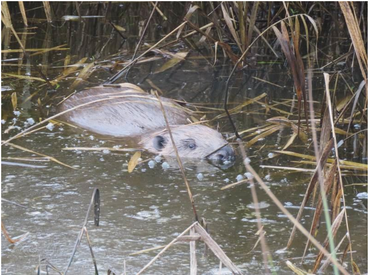
Biber auf nahe Entfernung in einem der Gräben.