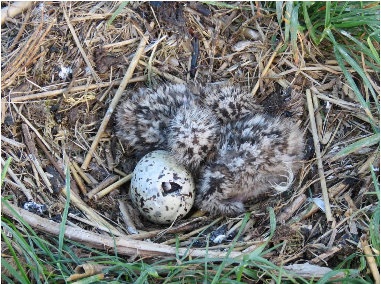
3 schlüpfende Schwarzkopfmöwenküken