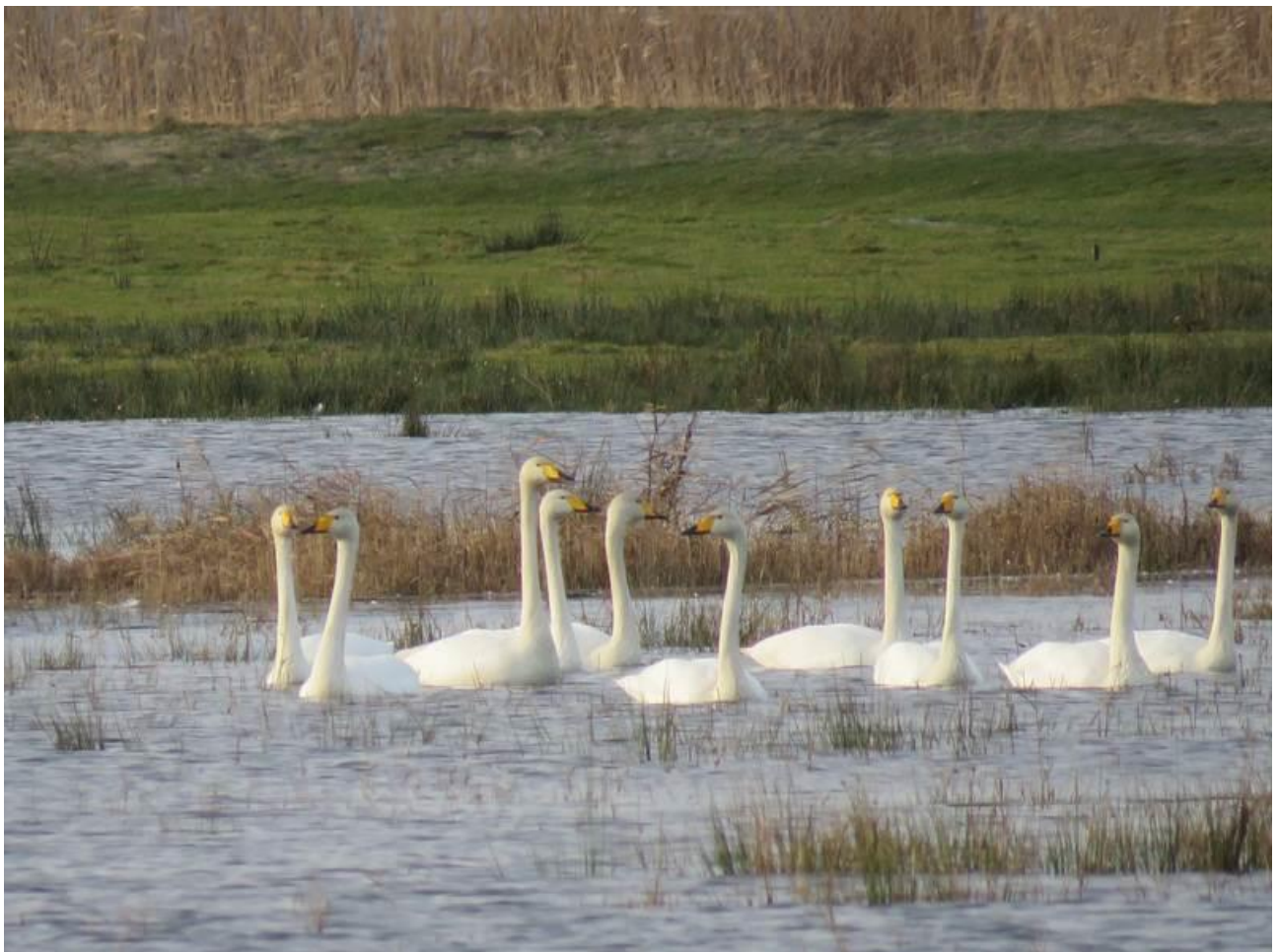
Singschwäne auf überflutetem Grünland