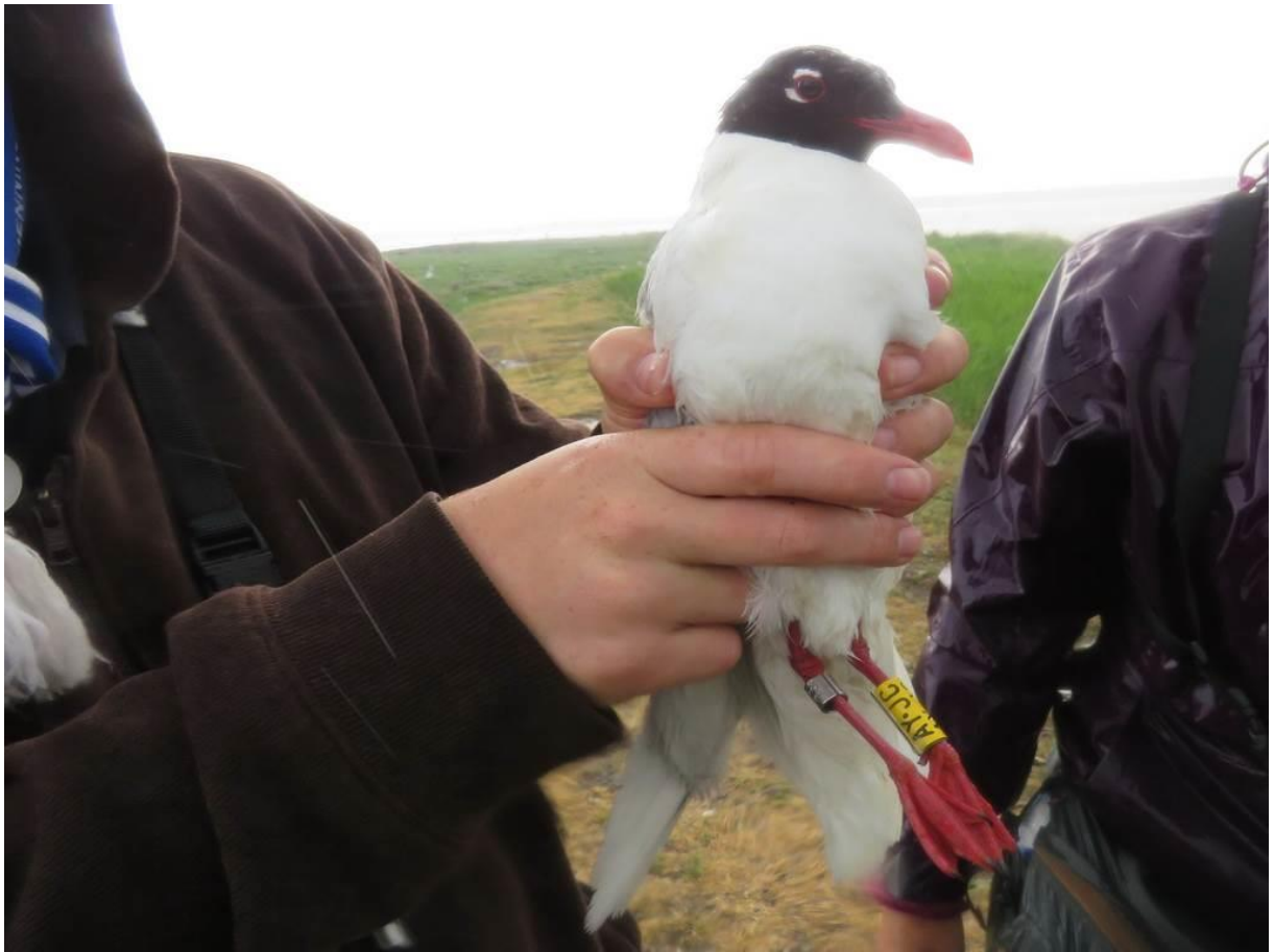
Beringung von AYJC gelb