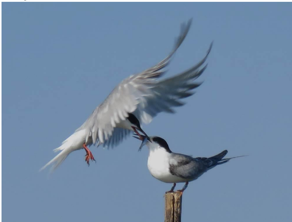
Der Jungvogel wurde am 23.08.2018 noch von seinen Eltern gefüttert

Beringt am 10.07.2018 auf einem künstlichen Brutfluss Nonnenhof, Tollensesee