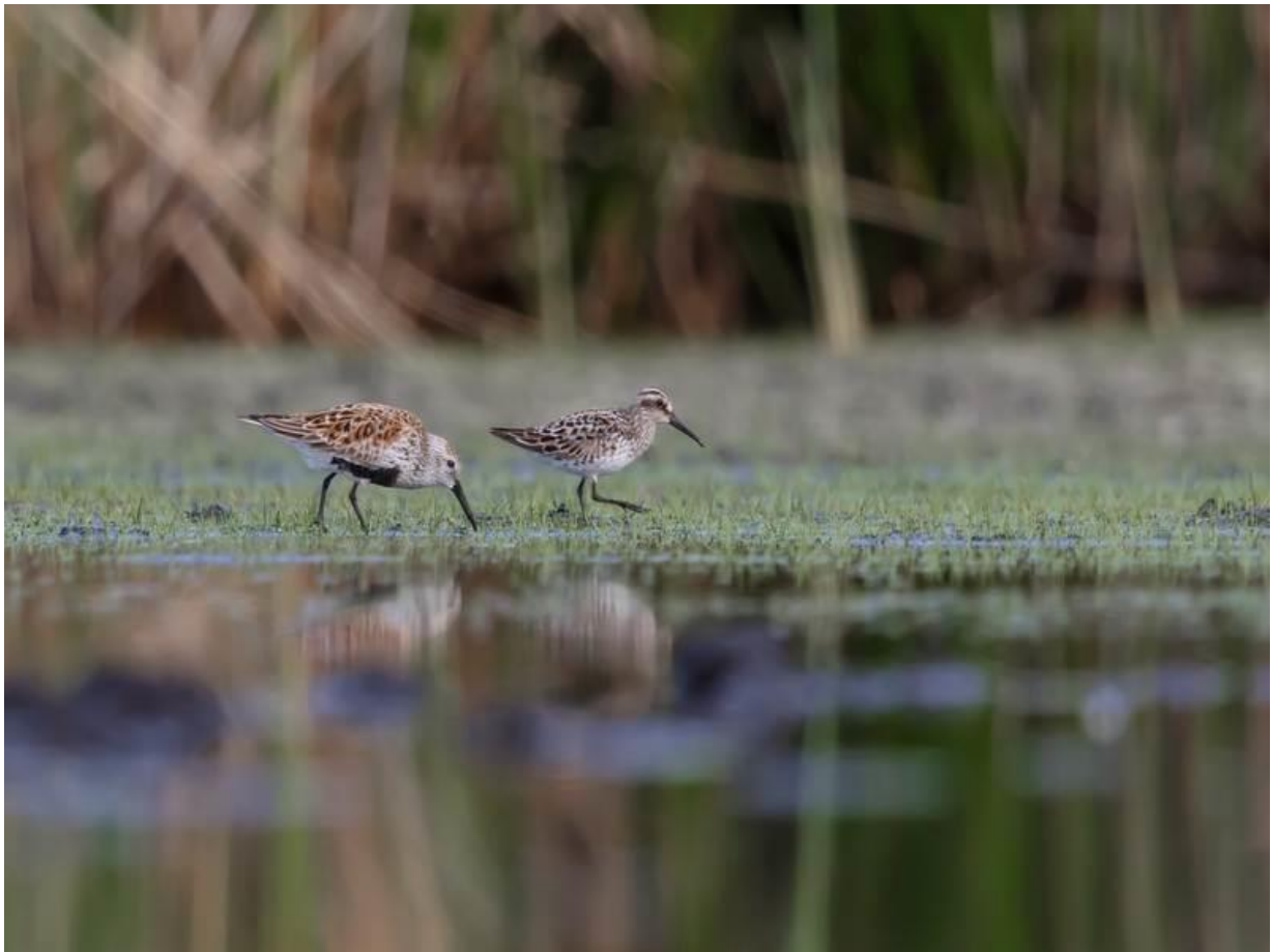
Sumpfläufer und Alpenstrandläufer 16.05.2018