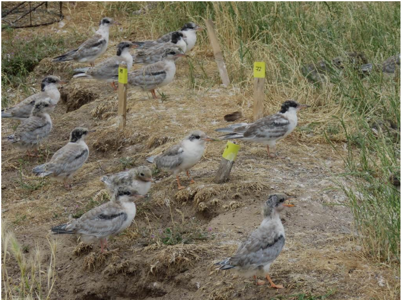
Flügge Flussschwärmer 2018