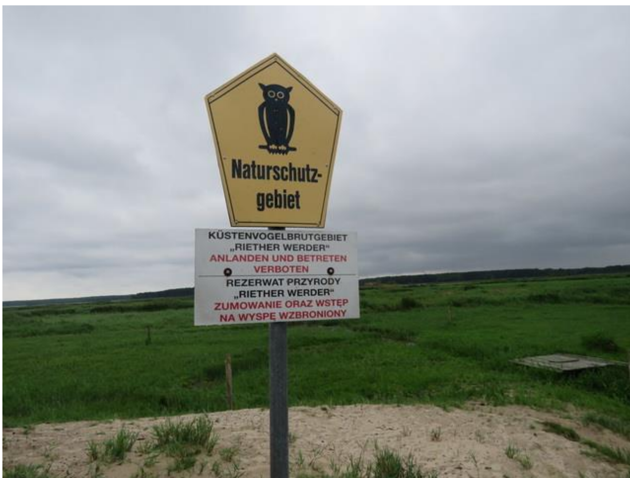
Ausschilderung der Insel

Wie in den vergangenen Jahren wurden ab Ostern mit Genehmigung der Unteren Naturschutzbehörde, wöchentliche Führung für bis zu 20 Personen angeboten. Dadurch, dass es nun seit Jahren eine legale Möglichkeit gibt, die Insel zu besuchen, gingen die illegalen Betretungen stark zurück. Diese Führungen wurden sehr gut angenommen. Die Bootsfahrten zur Insel wurden gemeinsam mit Dietmar Janz, Rieth und dem fördervereinseigenen Boot durchgeführt. Den Teilnehmern wurden Zusammenhänge zwischen Landschaftspflege, Jagd und Naturschutz vermittelt und wie spätere Gespräche mit Unterkunftsvermittlern in Rieth ergaben, war die Begeisterung bei den Gästen groß. Auch Bewohner der Ortschaft Rieth nahmen diese Besuchsmöglichkeit an und dadurch konnte wieder einiges zur Akzeptanz des Naturschutzes in der Region getan werden. Illegale Besucher aus Deutschland und Polen bereiteten auch 2018 kaum Probleme.