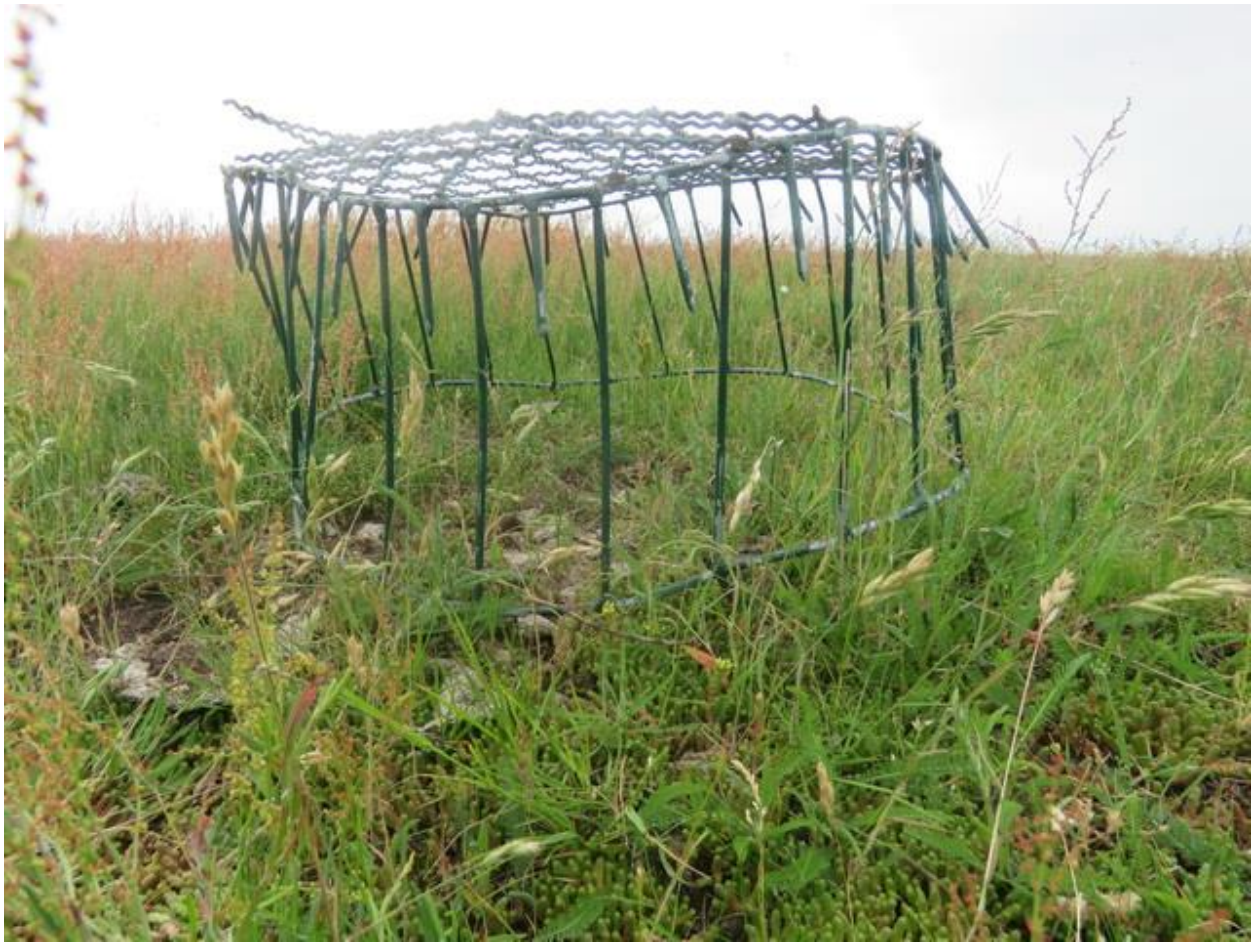
Nesthaube auf einem Kiebitzgelege zum Schutz gegen Rabenvögel