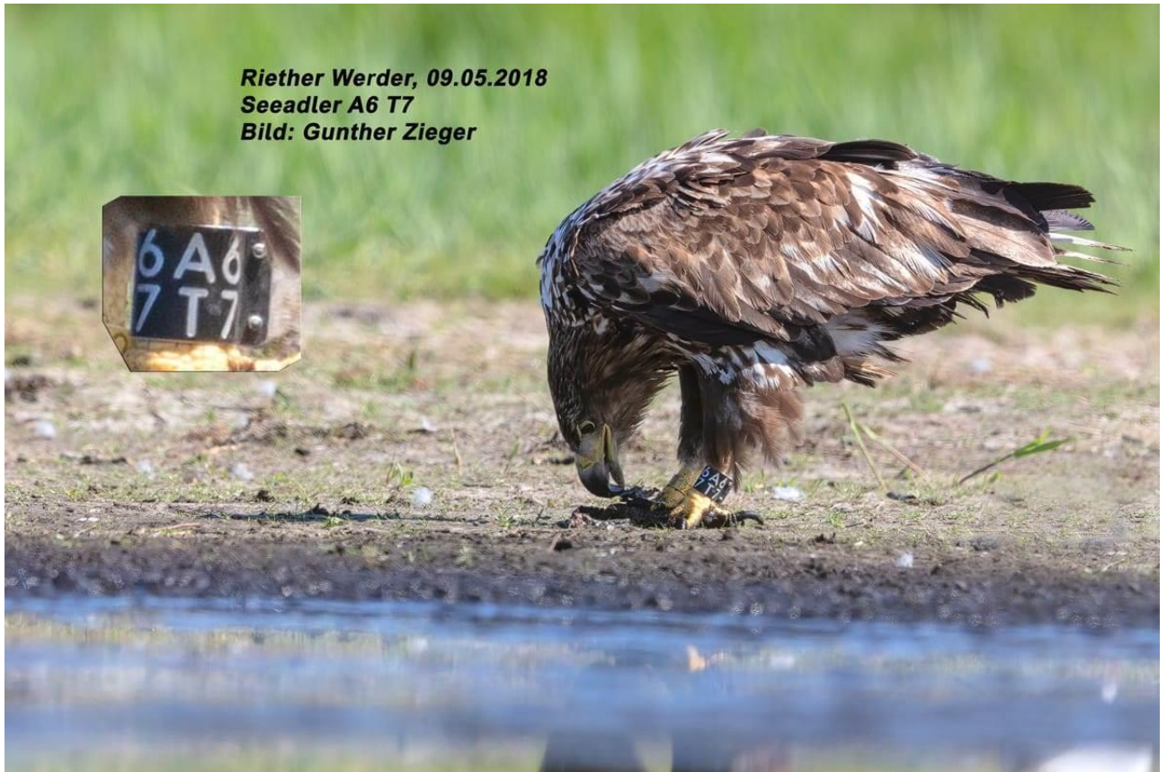
Riether Werder, 09.05.2018 Seeadler A6 T7