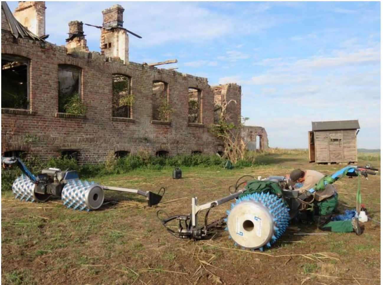
Wartungsarbeiten an den Einachsmähern des Haffwiesenhofes.