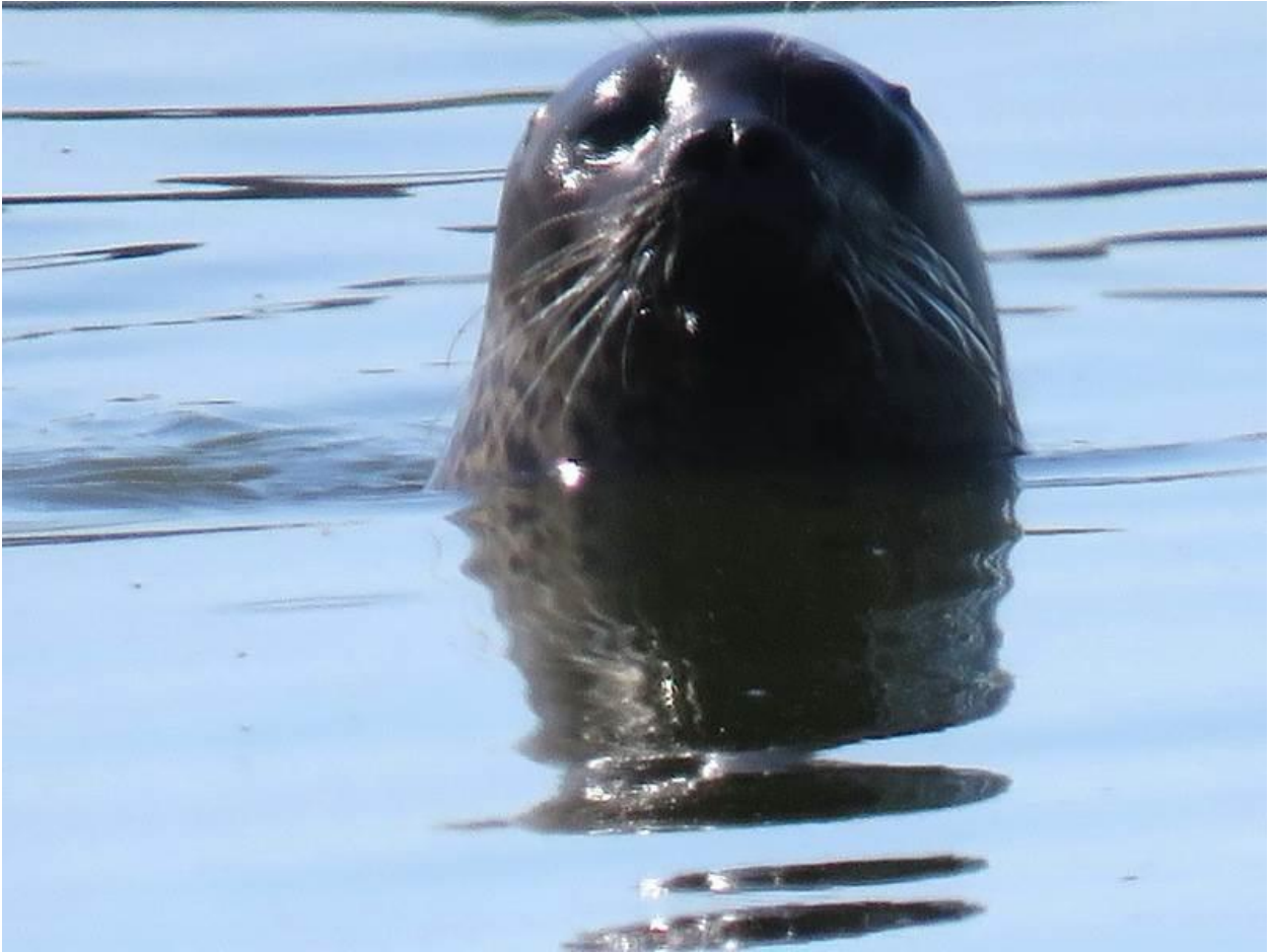
Seehundfotos im Mittagslicht