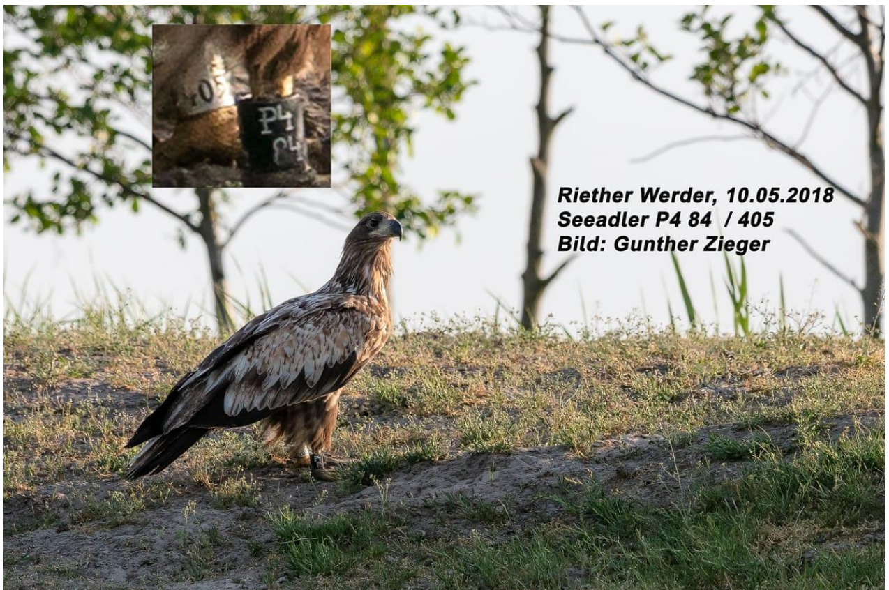
Riether Werder, 10.05.2018 Seeadler P4 84 / 405

Beringt 23.05.2017 Thurbruch, Insel Usedom 26 km NNW