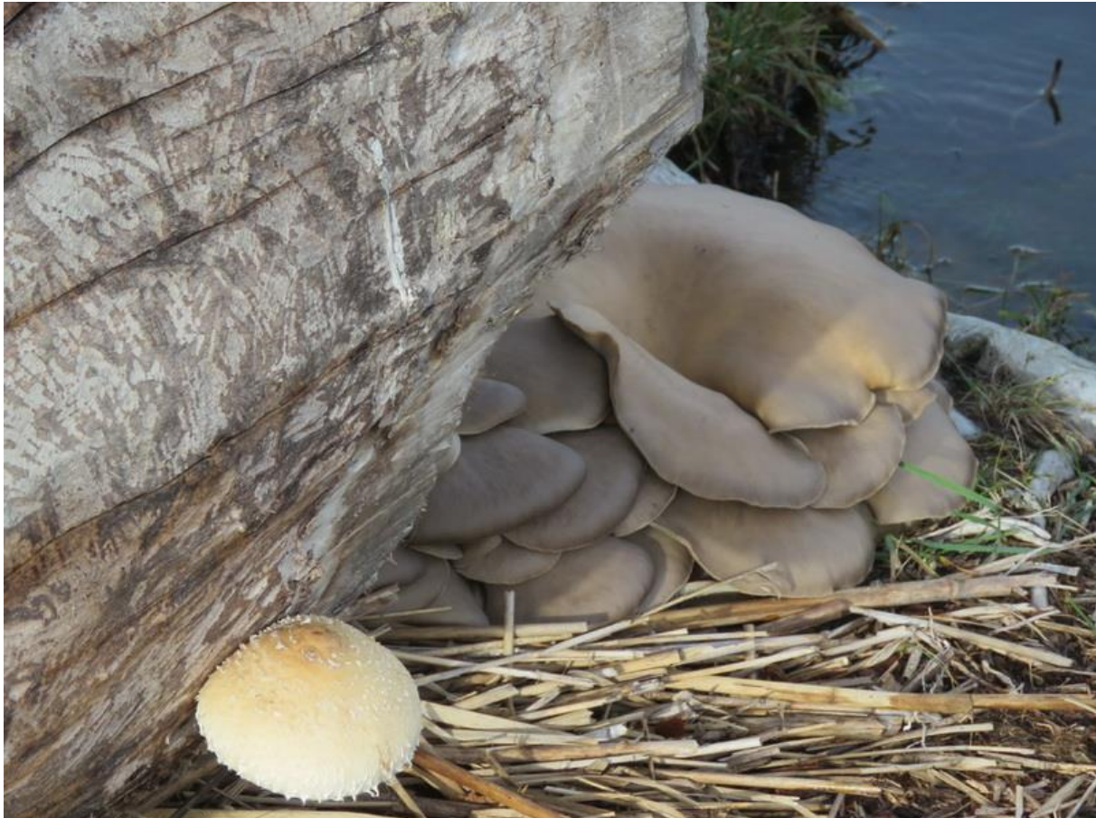
An der 2017 vom Biber gefällten Pappel wuchs 2018 der Speisepilz Austernseitling