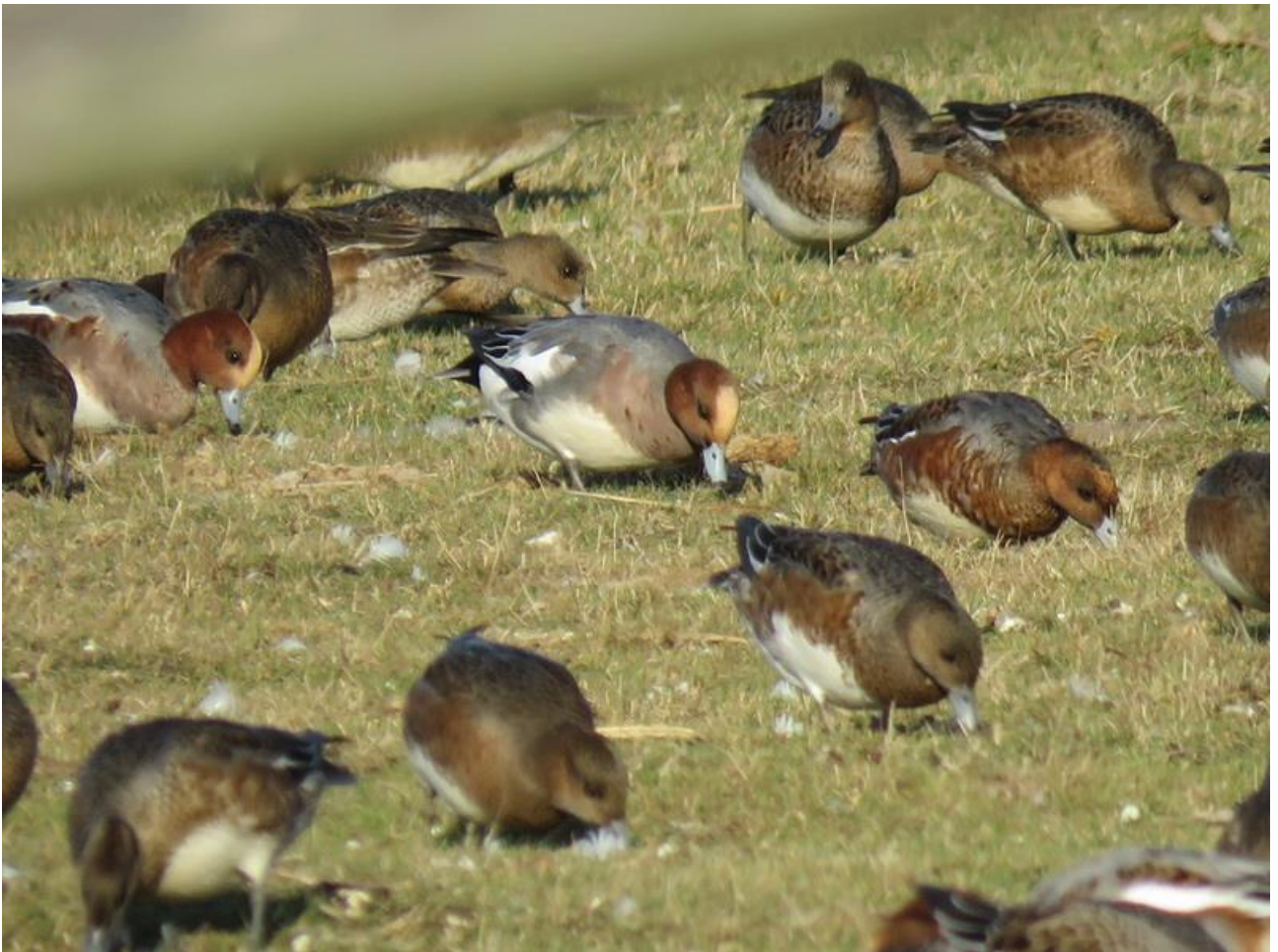
Pfeifenten im Grünland