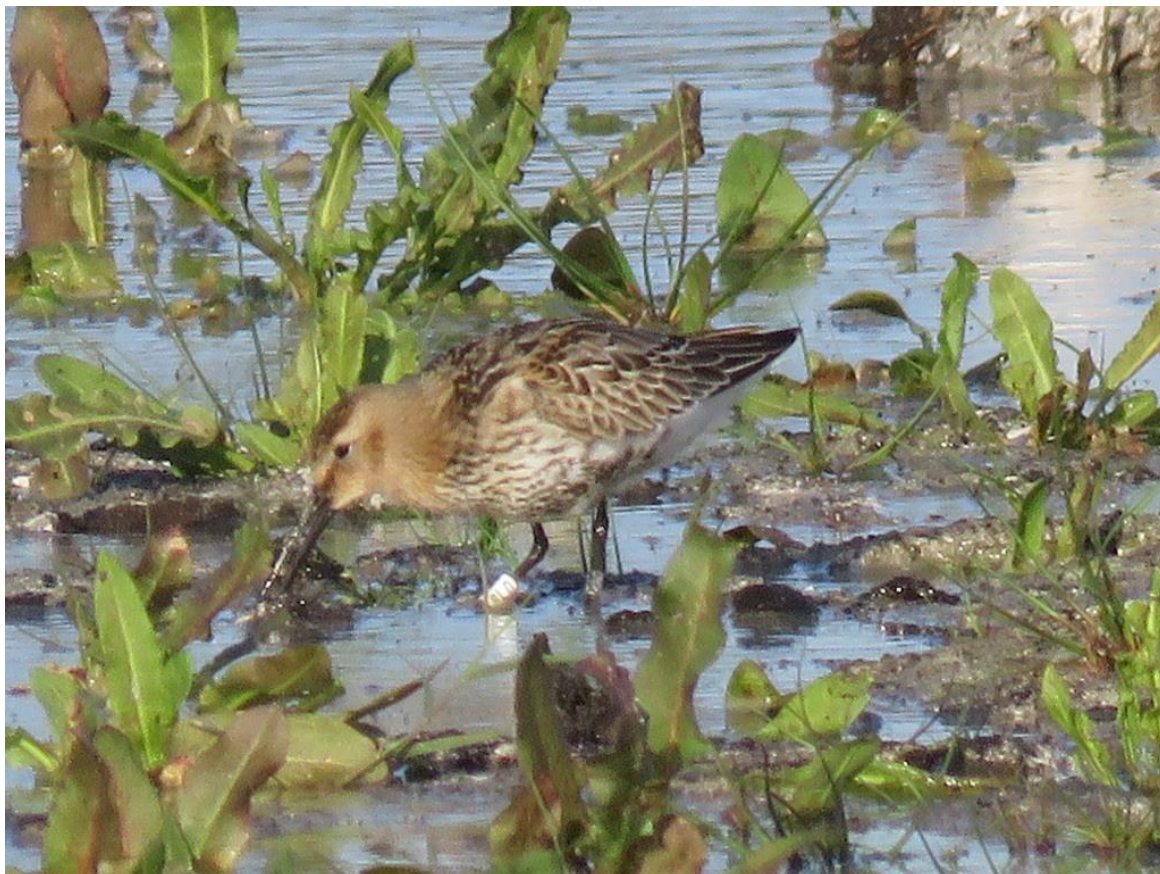
Farbberingter Alpenstrandläufer, 28.09.2018