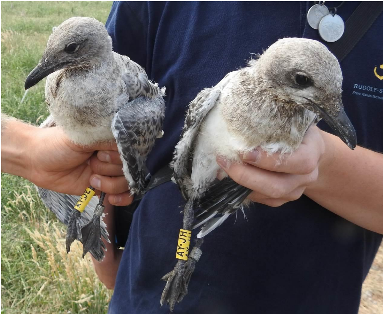
Die ersten farbberingten Schwarzkopfmöwenküken auf dem Riether Werder